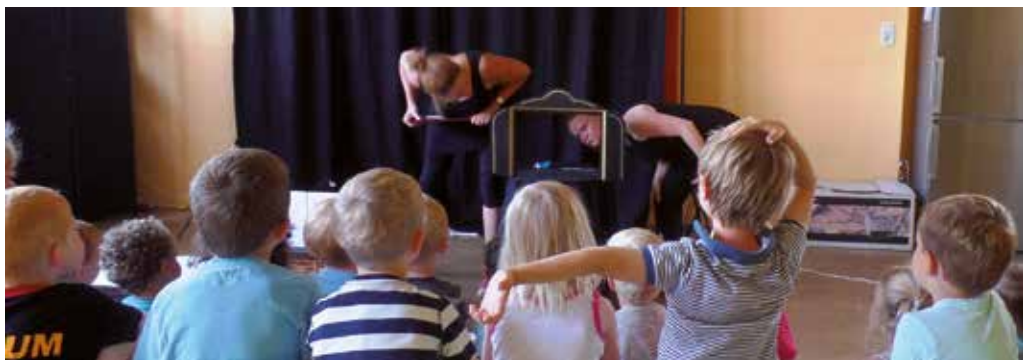
Enfants de classes d'accueil à la 3 ème maternelle